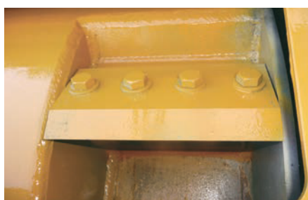
Les couteaux du tambour sont faciles d'accès et simples à démonter.